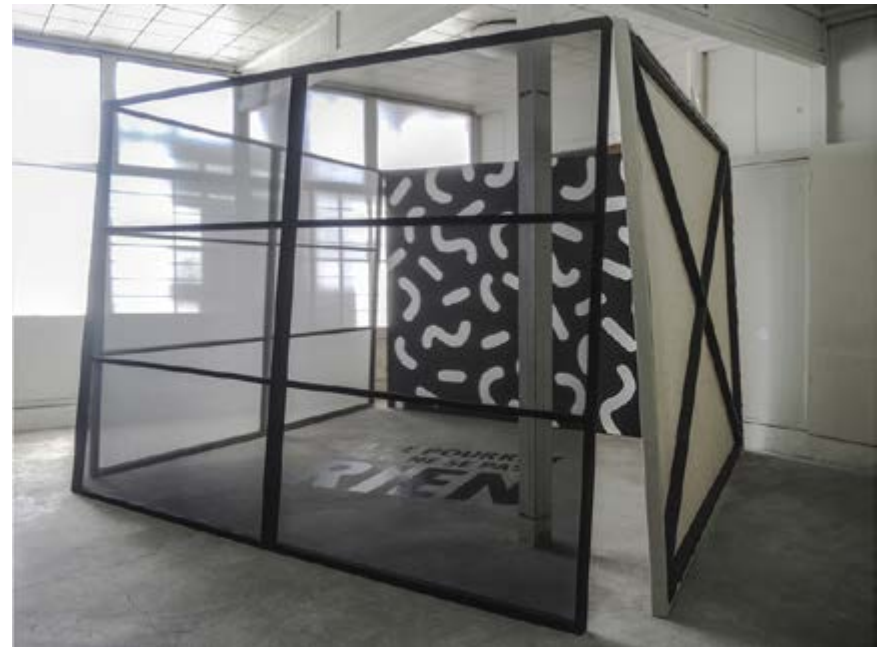
Ci-contre : Quentin Lefranc, Washitsu Avec l'intervention graphique de Marine Jezequel. Exposition Time Capsule , Takasaki, Japon, 2016. Bois peint, toile brute, voile polyester, vinyle.