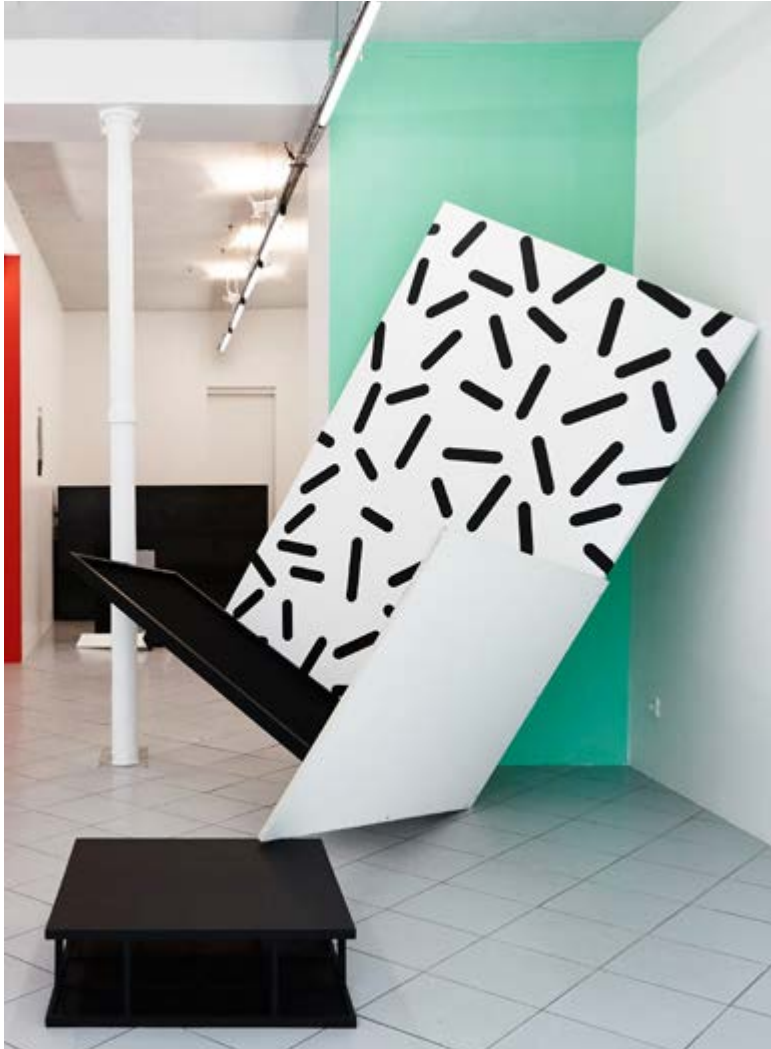
Quentin Lefranc, In Principio (e poi) , détail Exposition Picture seemed not to know how to behave Galerie Jérôme Pauchant, Paris, 2015. CPP, bois, PMMA, papier, acrylique, 3 panneaux assemblés - Crédit photo: Molly SJ Lowe