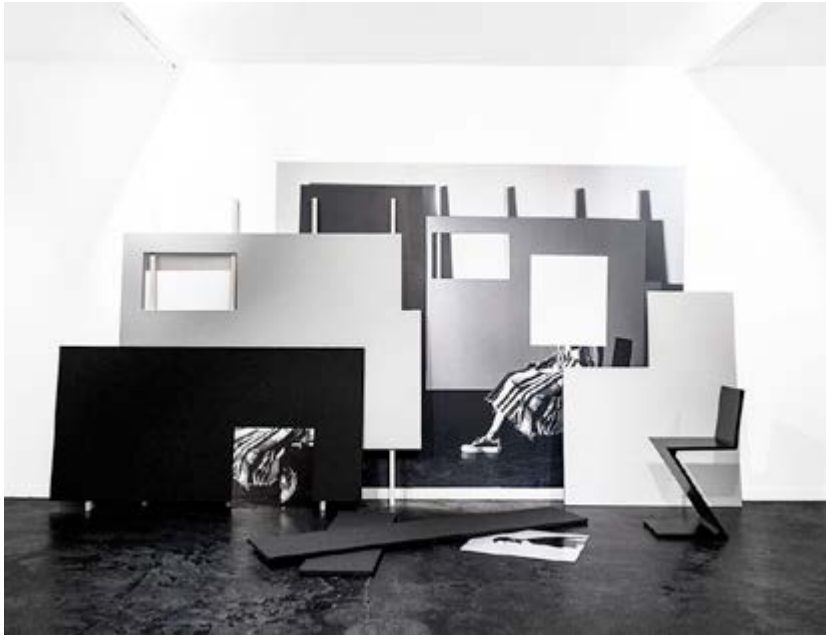
En haut : Quentin Lefranc, Arrangement en noir et gris, continuation Tom Greyhound, Paris, 2016. Toiles tendues sur châssis, peinture acrylique, tasseau de bois et contre-plaqué et intervention photographique de Molly SJ Lowe. - Crédit photo: Molly SJ Lowe