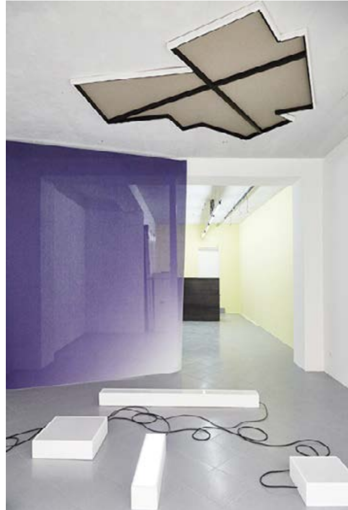
Quentin Lefranc, Beyond notation, Incomplete canvas et Background n°1 Exposition Exposed II , galerie Jérôme Pauchant, Paris, 2017.